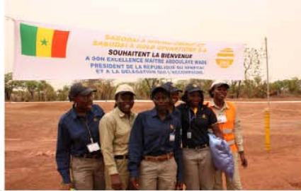
Personnel de SGO