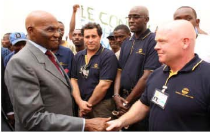
Son excellence Maïtre Abdoulaye Wade, Président de la République du Sénégal, rencontre le personnel de SGO