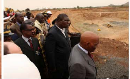
Le Président examine la mine