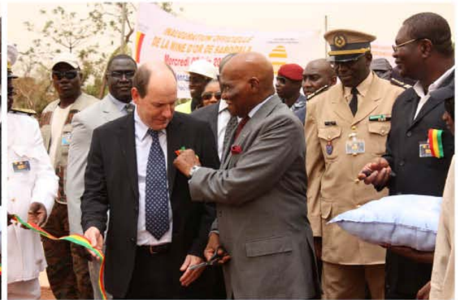
La présentation du drapeau Sénégalaise aux ministres de la République du Sénégal et représentatives de