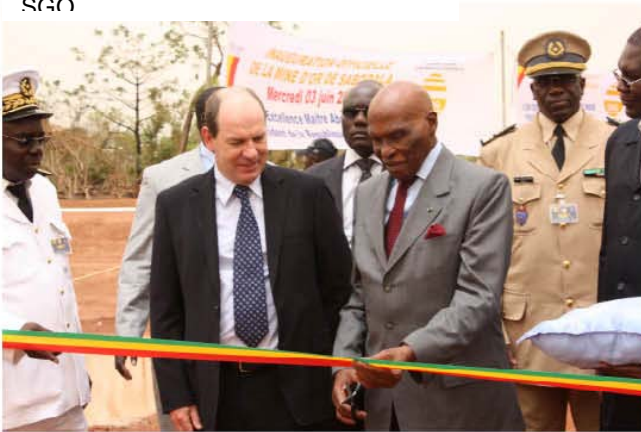
Ouverture officielle de la mine d'or de Sabodala